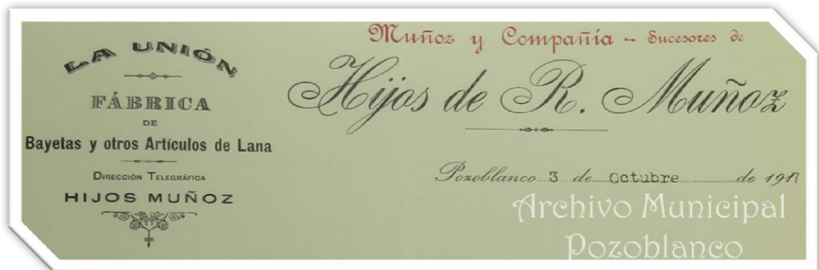
Membrete de la fábrica de Los Muñoces en 1917. Archivo Municipal de Pozoblanco.

Además, en los padrones de matrículas de industria aparecen más de 7 comercios de venta de tejidos, a los que debemos unir los talleres relacionados, como husos, batanes, tintes o lavadoras. Es decir, la escasez de este pequeño artículo, el alambre de acero, necesario para la fabricación de las cintas de carda, pusieron en jaque a toda una industria textil como la catalana y por ende, a los fabricantes de Pozoblanco.