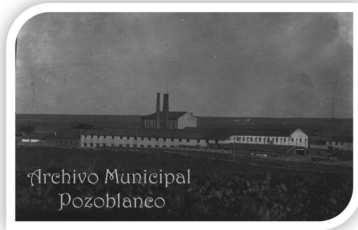
Fábrica de Los Muñoces.